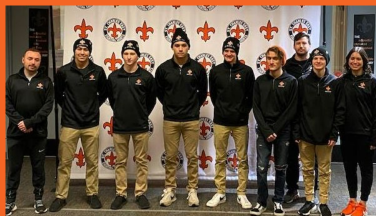
Niños de natación y zambullida Calificadores Estatales.