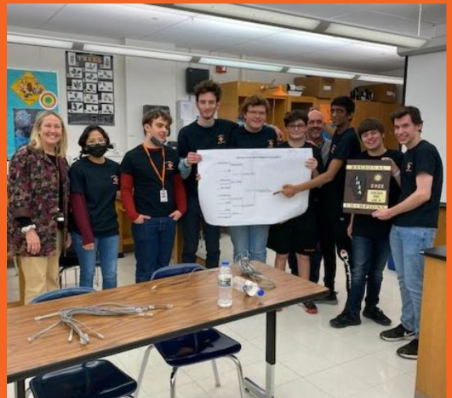
Equipo de Scholastic Bowl - Campeones Regionales