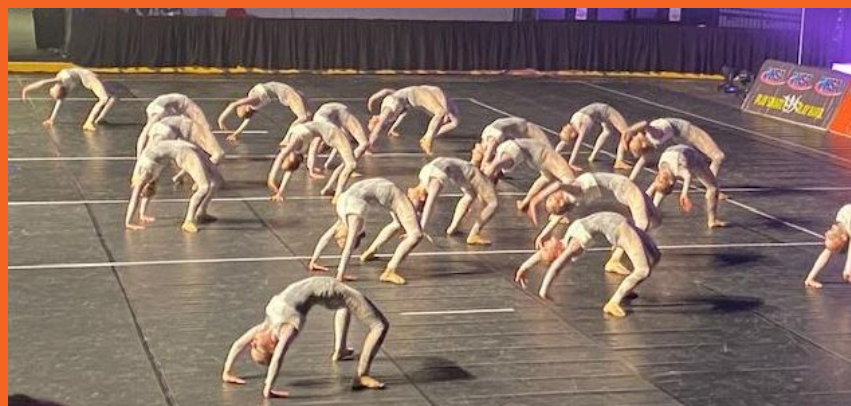
Danza de las niñas - 4to en el Estado