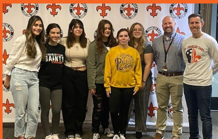
Envío de las chicas para competición de bolos