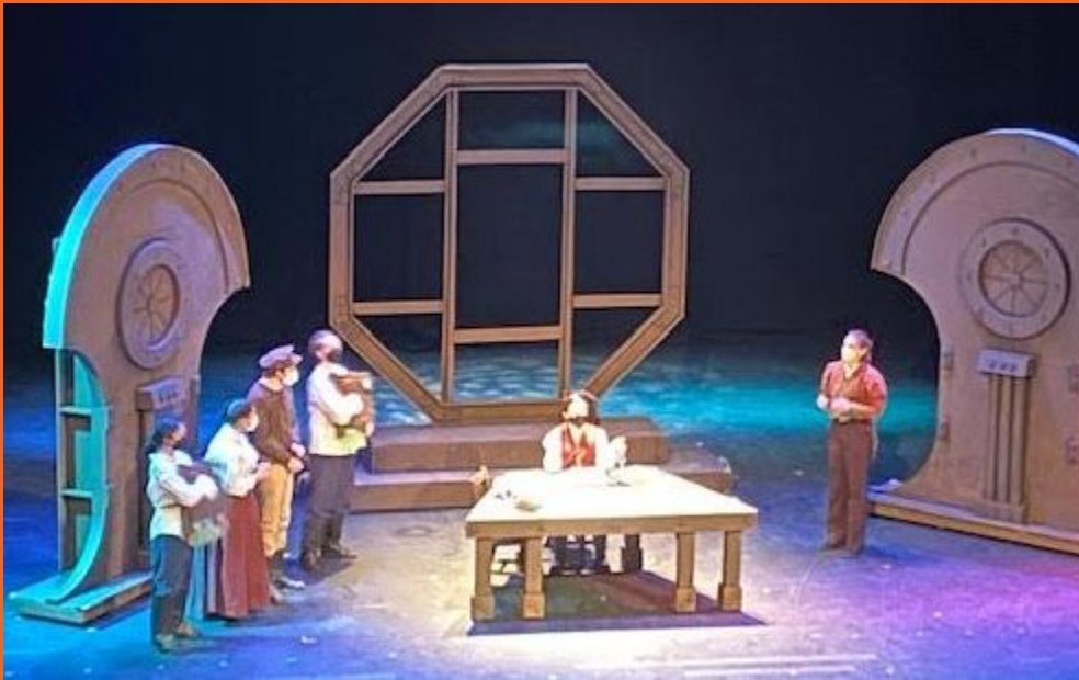
Obra de teatro de Invierno 20,000 Leguas de Viaje bajo el mar.