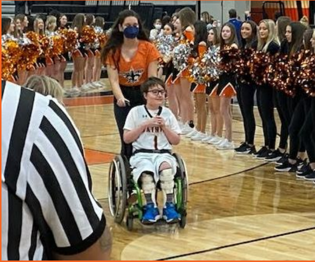
ISO Juego Grande