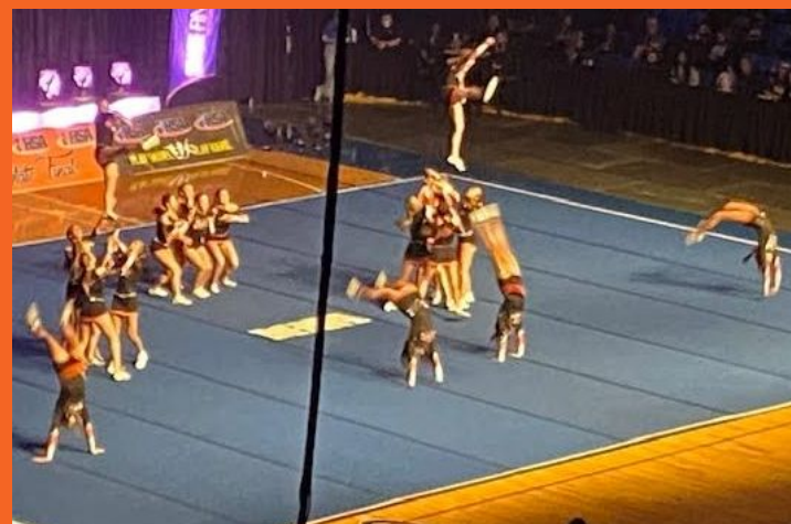
Porristas- Clasificadoras estatales