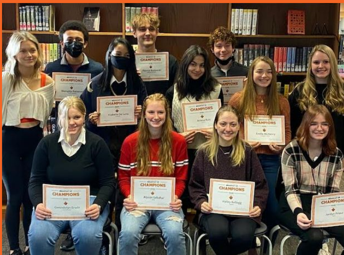
Desayuno de Campeones de Marzo