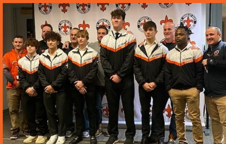
Lucha Libre y Clasificación Estatal