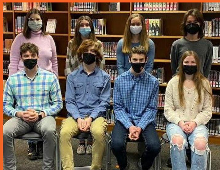
Desayuno de Campeones de Enero y Febrero