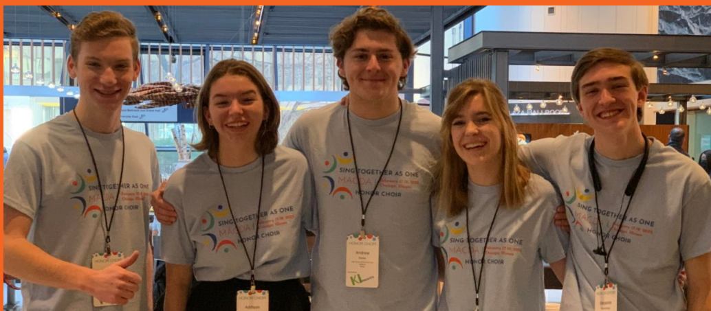
Taller Vocal de Jazz (derecha) y ILMEA (abajo)