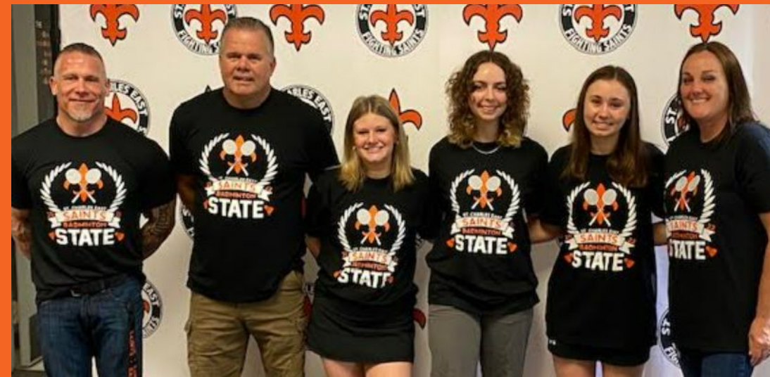
Envío del equipo de Badminton