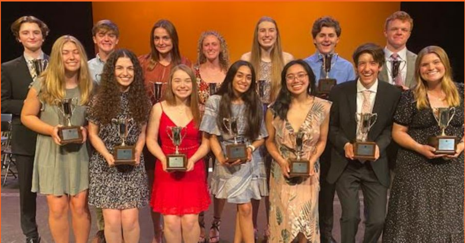
Destinatarios de la Flor de Lis 2022