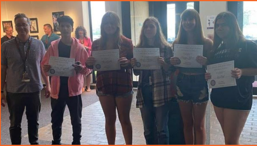
Galardonados de la Muestra de Arte de East