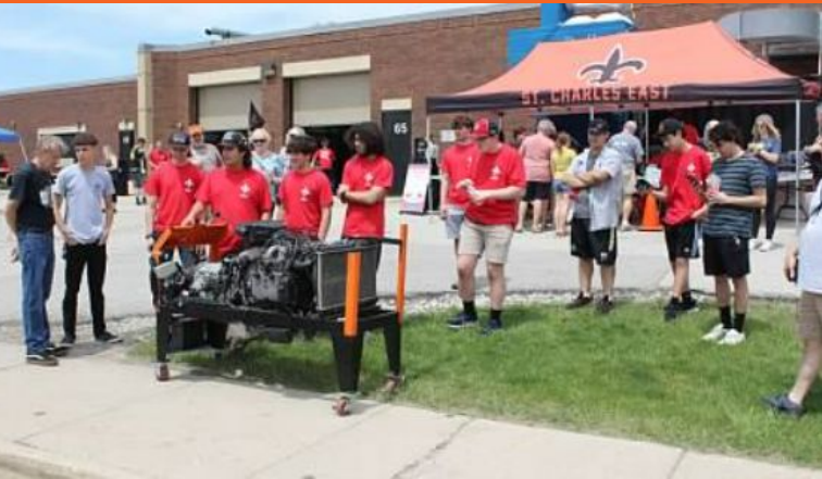
Muestra de Automóvil de East