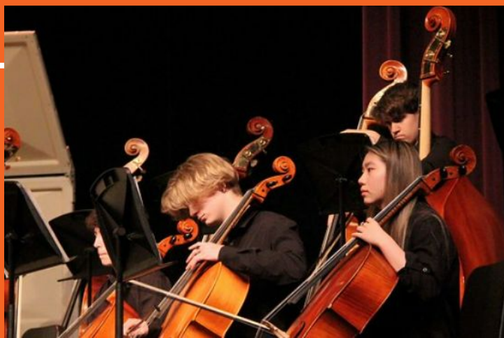
Concierto de la Orquesta