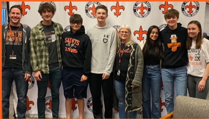
Despedida del equipo de matemáticas