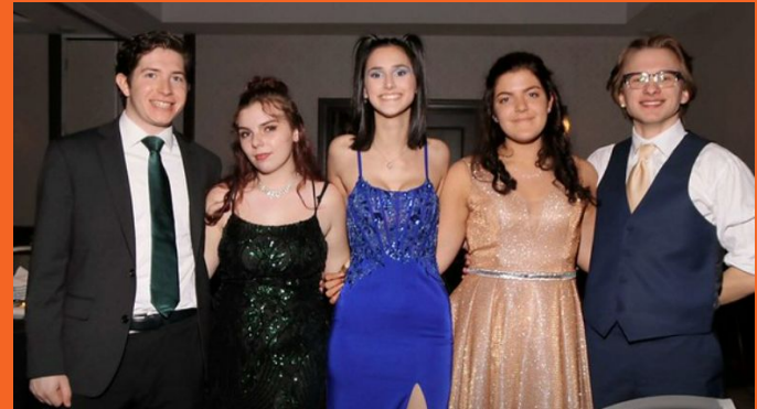
Baile de graduación de STCE