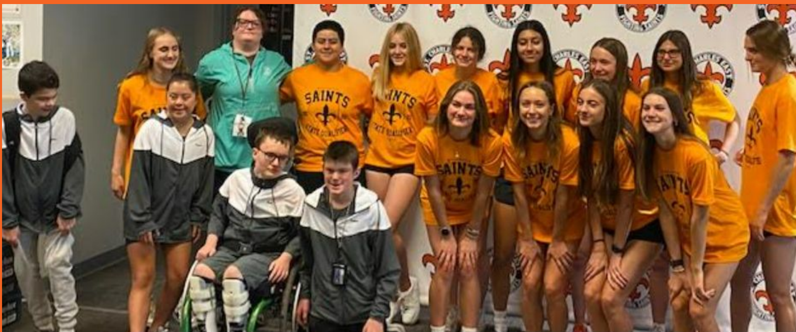
Despedidas de ISO y las chicas de carrera de pista