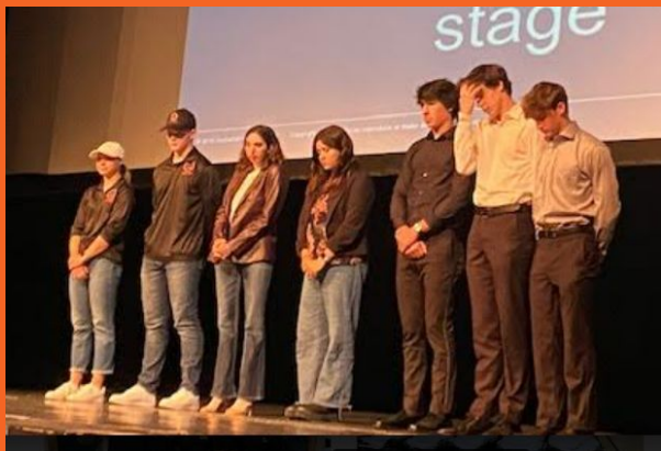
Noche de presentación final de Incubator