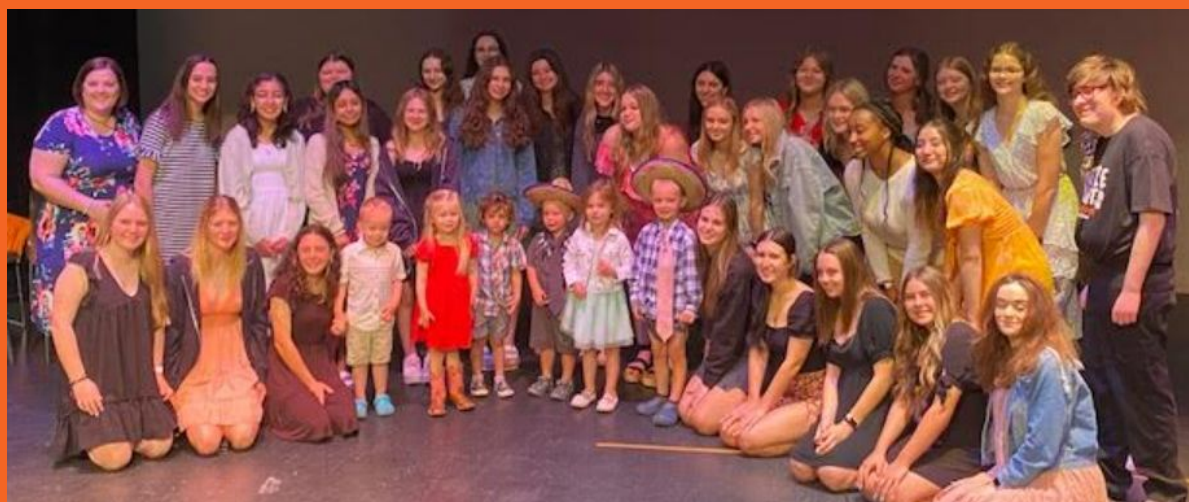
Graduación del preescolar Little Saints