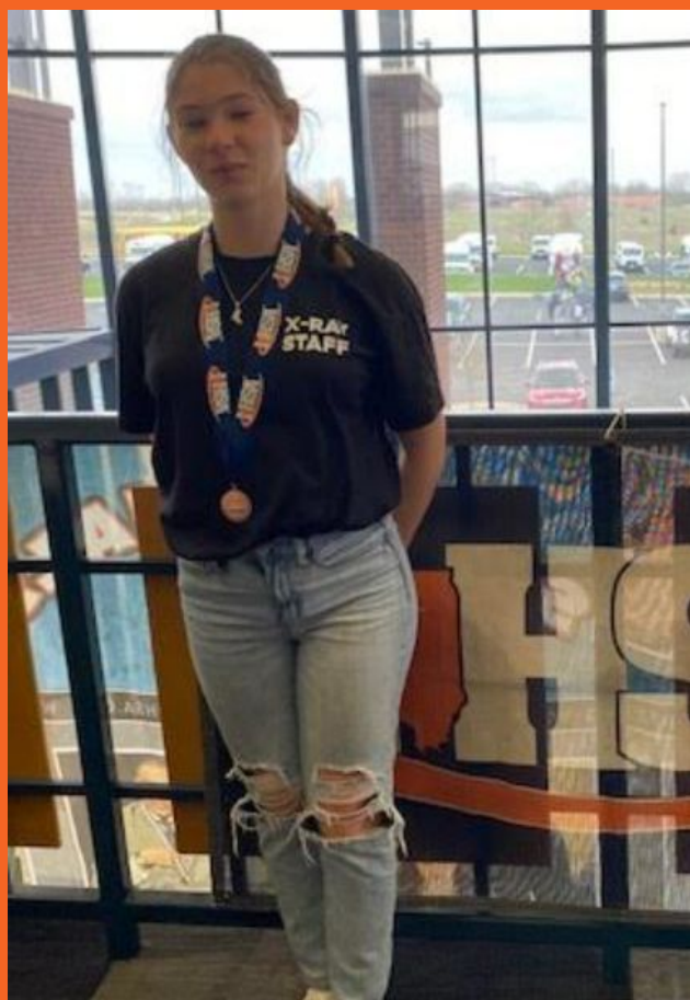
SKILLS USA en la competición estatal