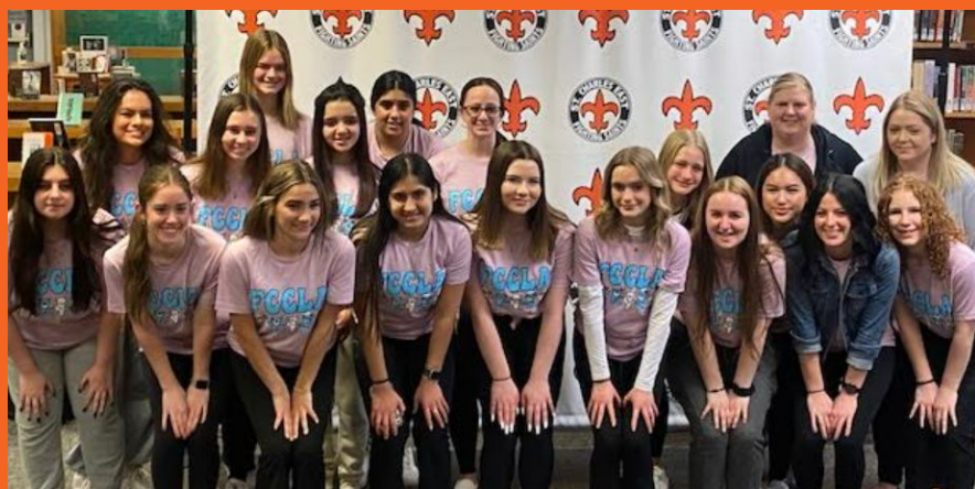
Clasificados estatales de FCCLA