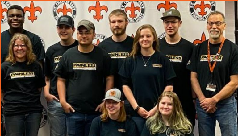
Despedida del equipo de STCE del Desafío de motores