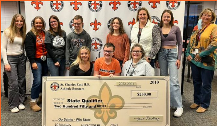
ISO Despedida para la Competición del Estado