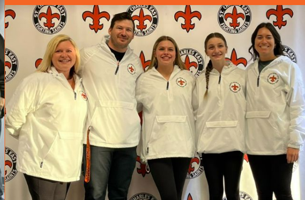
Despedida a las chicas de natación y buceo