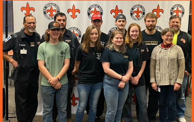
STCE Equipo del Desafío de Motores