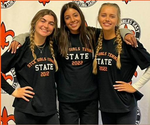
Despedida a las chicas del tenis