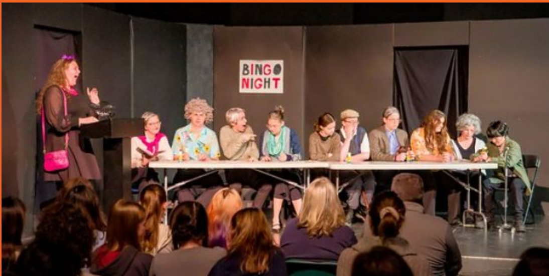
Obra de Un Acto Dirigida por Estudiantes