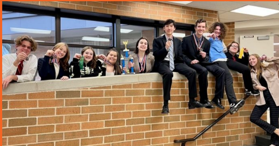
Equipo de Oratoria e Actuación de la STCE