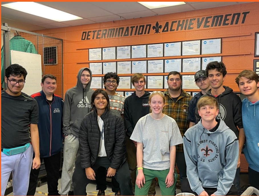
Estudiantes de automoción que obtienen la certificación ASE/AIIData