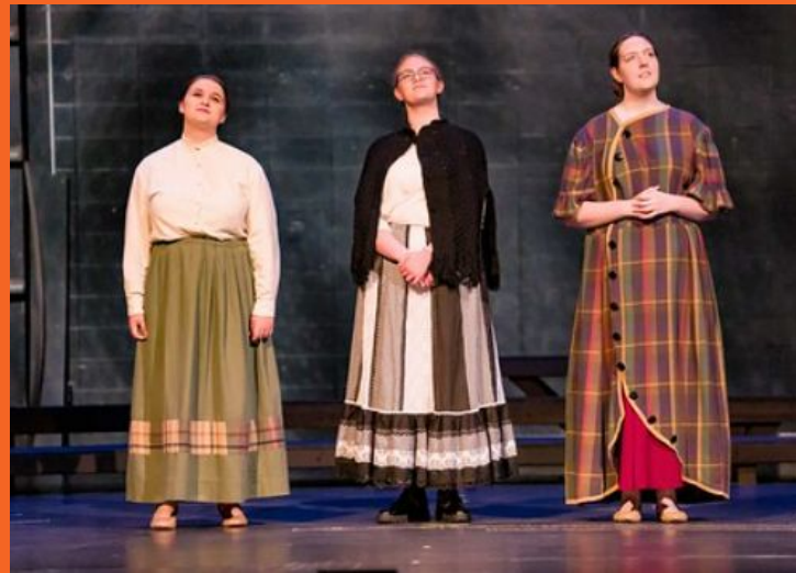
Obra de Otoño - Our Town (Nuestro Pueblo)