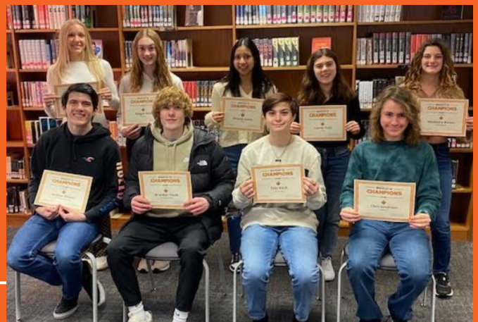
Desayuno de Campeones de noviembre y diciembre