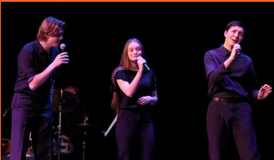
Concierto de Jazz Vocal