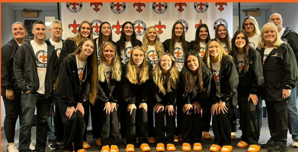
¡Despedida a las chicas de voleibol para la Competición del Estado - 4 ° en el Estado!