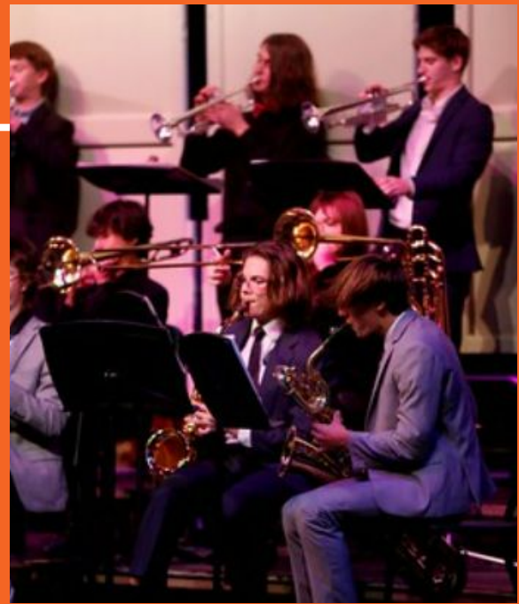
Concierto de la Banda de Jazz