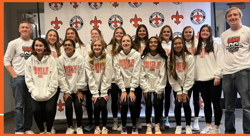
Equipos estatales de campo a través (cross country) masculino y femenino