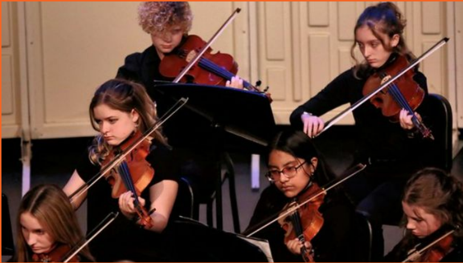
Concierto de la Orquesta