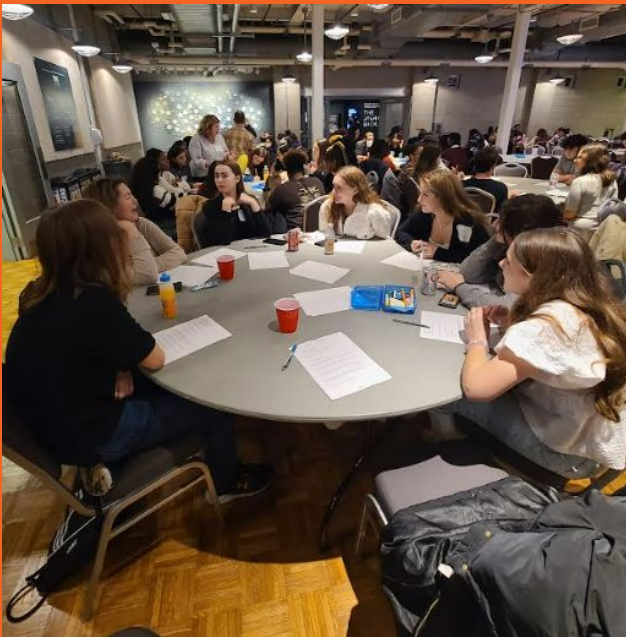
El Modelo de la ONU participa en las Jornadas de Liderazgo Estudiantil en el Museo del Holocausto