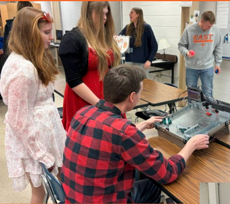
Proyecto Lead the Way principios de las arcadas de ingeniería