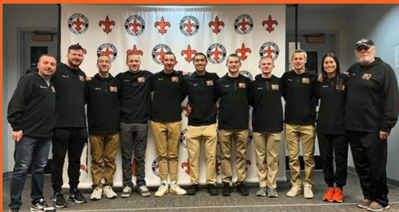
Despedida de natación y buceo de niños