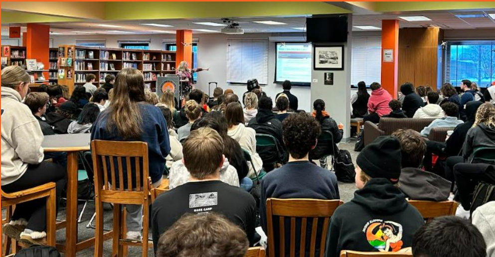
La Oficina del Secretario del Condado de Kane presenta a los estudiantes de los grados 11 y 12