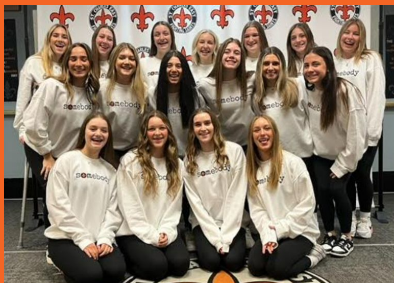
Despedida de baile