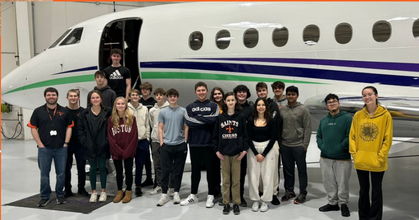
Proyecto Lead the Way viaje de campo de ingeniería aeroespacial al aeropuerto de DuPage