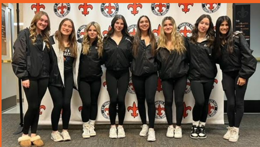
Despedida de gimnasia