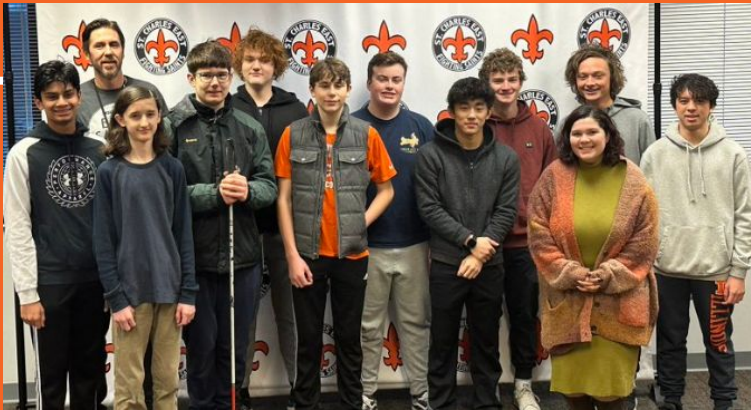
Despedida del equipo de ajedrez