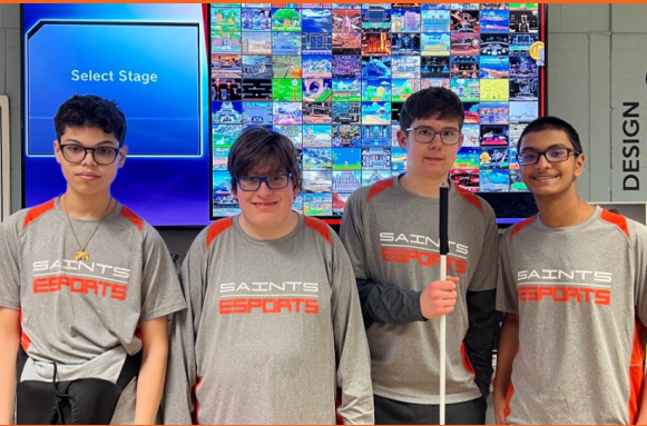
Equipo Super Smash de deportes electrónicos de los Saints