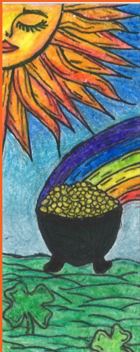
JR Avilés - Ganador del concurso de marcadores de marzo