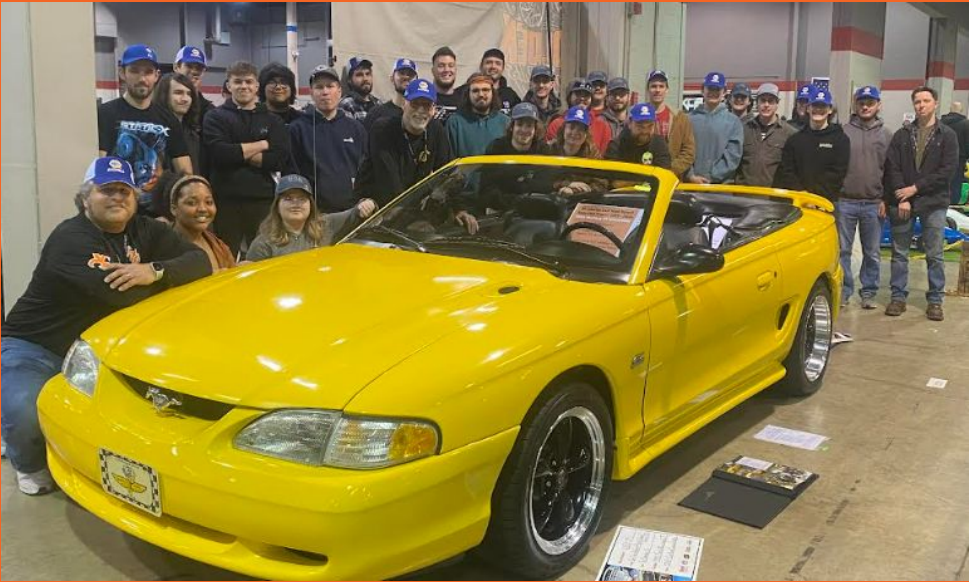
Auto Club inscribió el “Rustang” en el World of Wheels Show