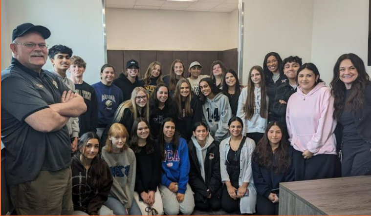
Excursión de conceptos avanzados de atención médica de la oficina forense del condado de Kane