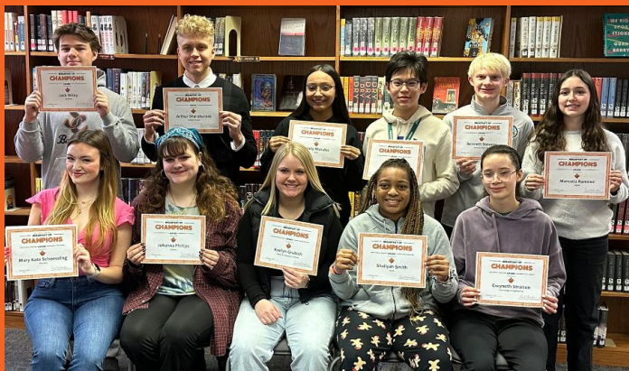
Desayuno de Campeones de febrero