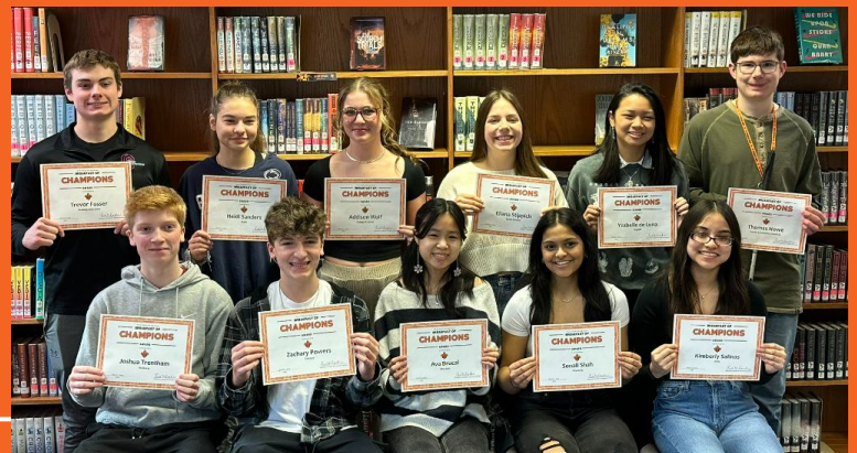
Desayuno de Campeones de marzo