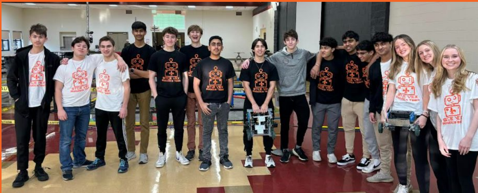
Concurso de Robótica VEX