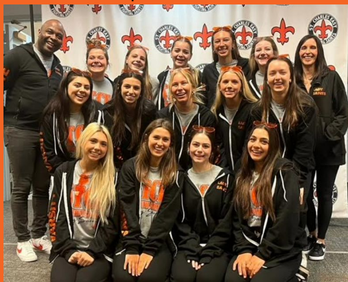
Despedida de cheer