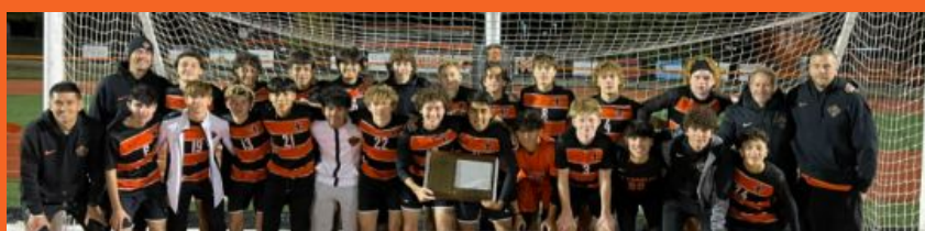
Fútbol masculino - Campeones de la conferencia DuKane