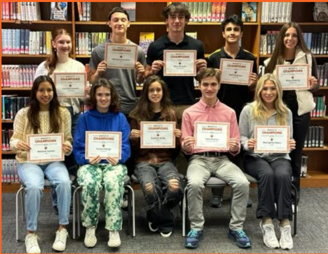
Octubre 2023 Desayuno de Campeones