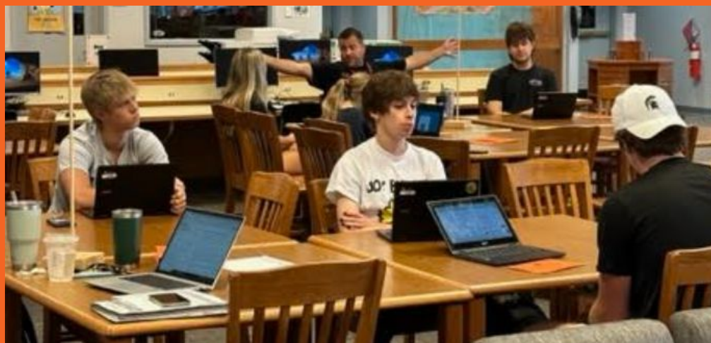
Reuniones de CCR de estudiantes del grado 12o