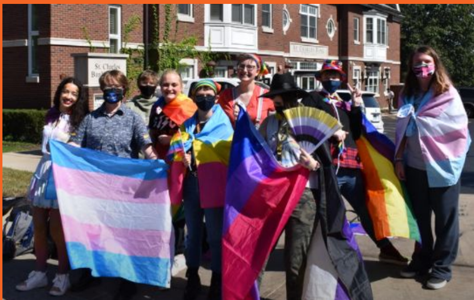
GSA en el desfile de Homecoming