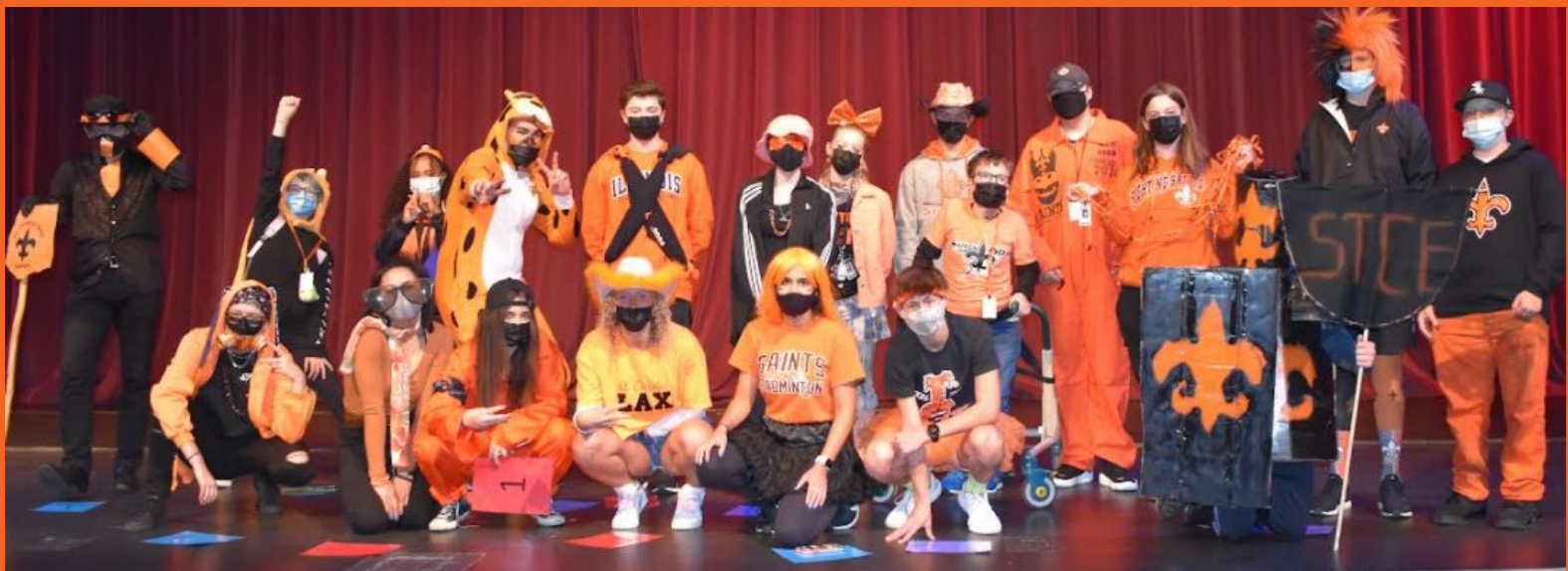
Ganadores del concurso naranja y negro