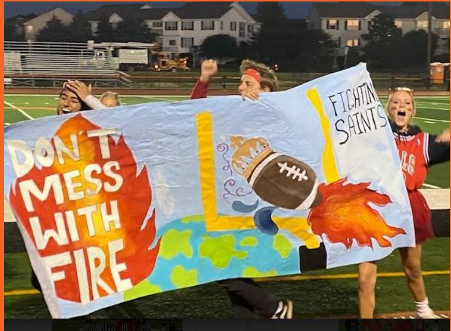
Alumnos del último año de pancartas (arriba) y tamborileo (abajo) en los juegos.