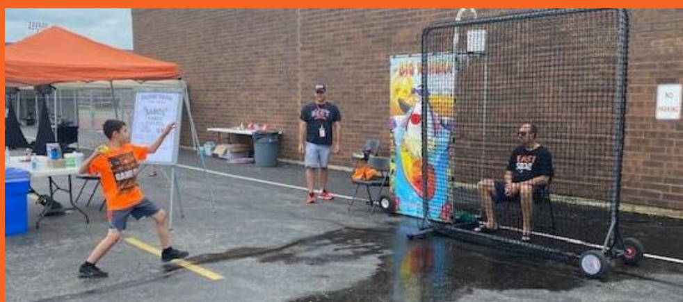
Festival familiar de diversión de los santos