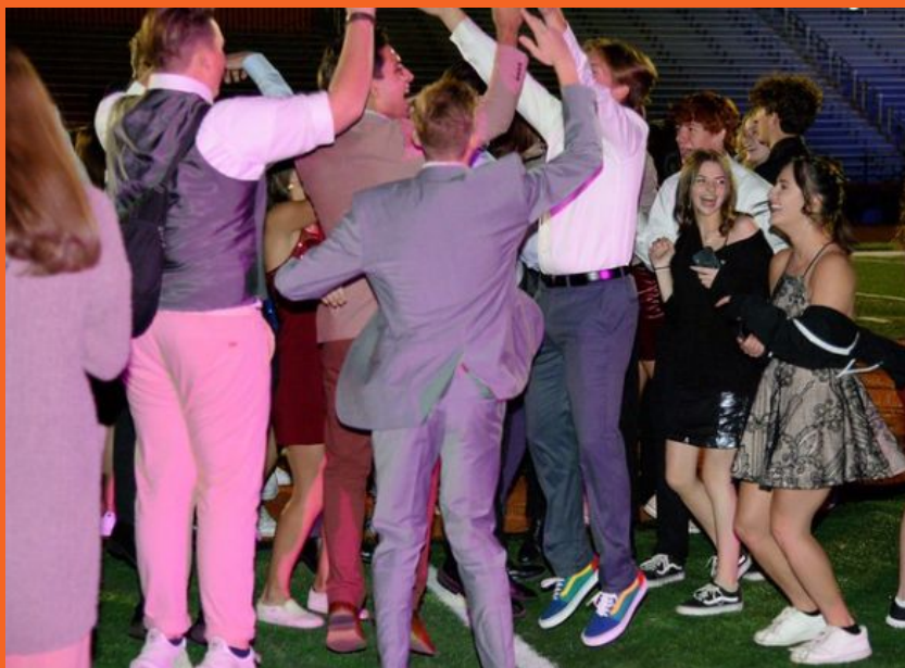
Fotos espontaneas del baile de Homecoming