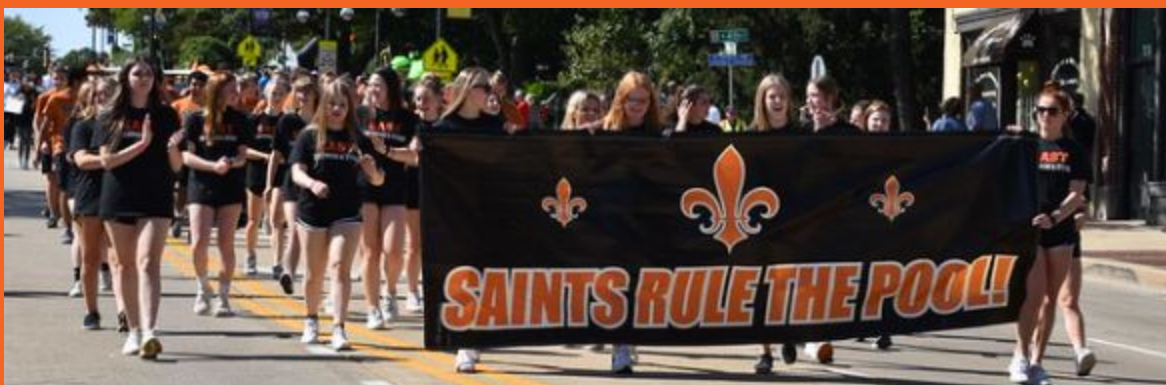
Equipo de natación y clavado de niñas en el desfile de Homecoming