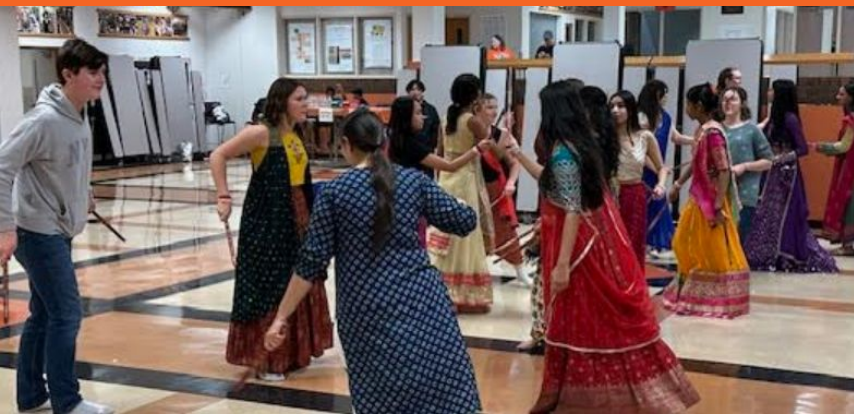
La Asociación de Estudiantes del Sur de Asia STCE organiza el evento Garba