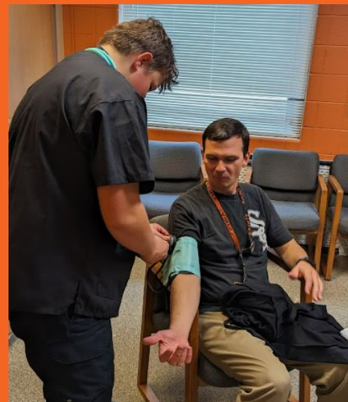
Conceptos avanzados de atención médica que los estudiantes practican tomando signos vitales