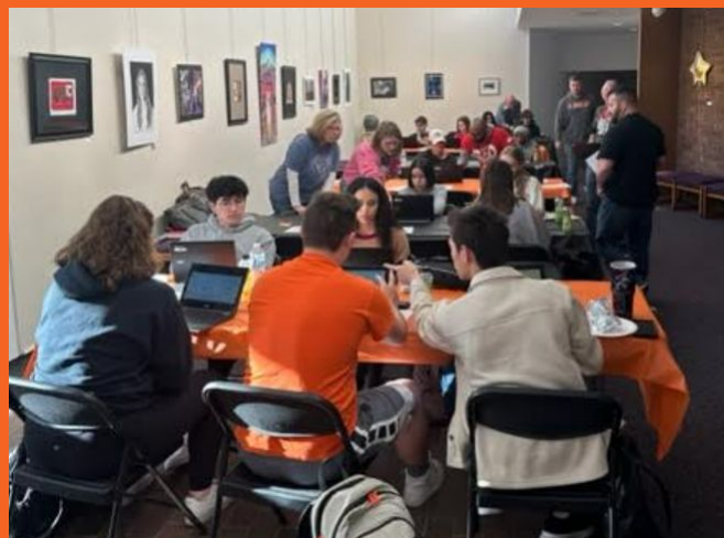
Desayuno de celebración para nuestros graduados de mitad de año