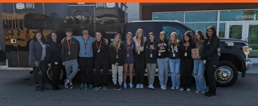
Estudiantes de conceptos avanzados de atención médica en una excursión a la oficina forense del condado de Kane