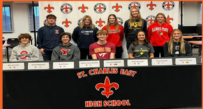
Día de la firma universitaria