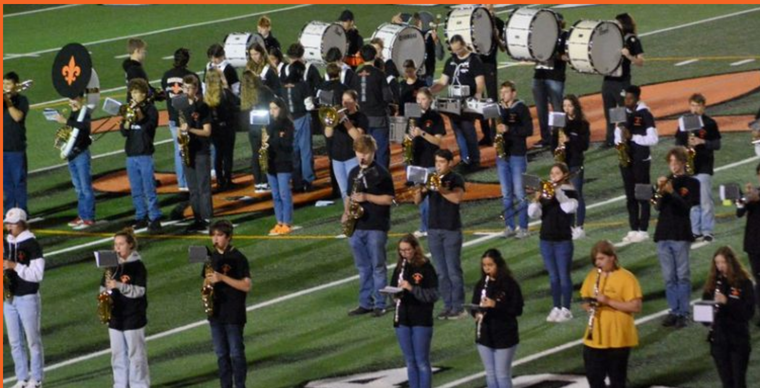
Concierto del Marching Band en el Norris Stadium