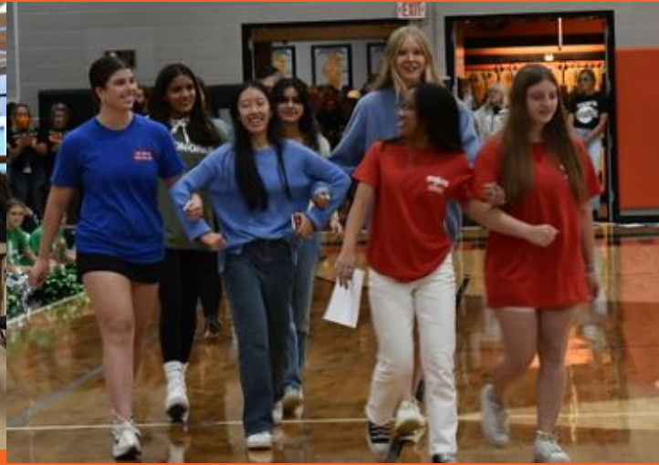
Consejo Estudiantil E-Board