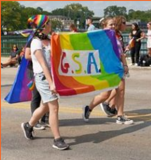
Desfile de Homecoming