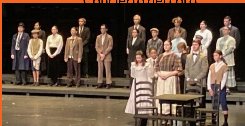
Obra de teatro de otoño - Nuestra ciudad