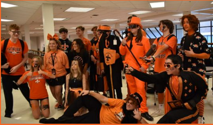
Participantes del concurso Orange & Black