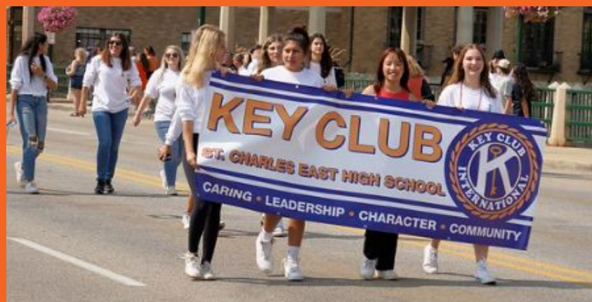
Desfile de Homecoming