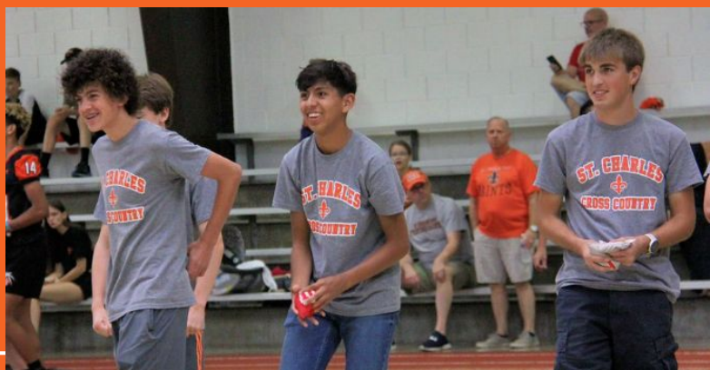
Fiesta de la diversión familiar de los Saints