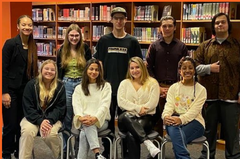
Beneficiarios del Desayuno de los Campeones de octubre