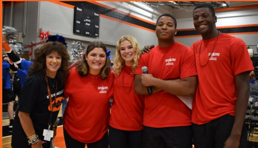
Presentadores del Homecoming