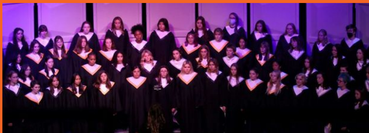
Concierto del coro